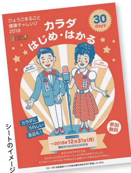
シートのイメージ