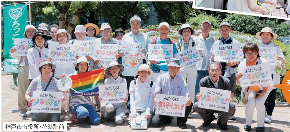
神戸市市役所・花時計前