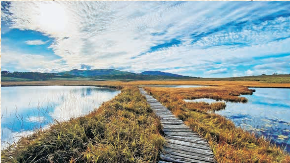
雨竜沼(北海道)

発行人:小西 達也 編集:機関紙編集委員会 組合員数 16,035人 出資金額 550,780,000円 平均出資額 34,349円 2025.12.9現在